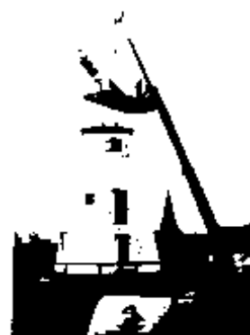
1984 The fitting of the new cap base