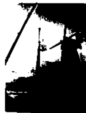
2002 Rot in the whips and sails forces sail removal