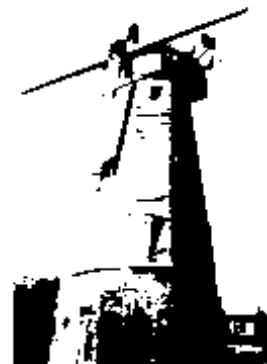
1979 The derelict windmill prior to restoration

In 2003, the Mill closed for refurbishment including work on the sails, fantail and cap turning gear with funding from the Heritage Lottery Fund, Ashford Borough Council and others. The Mill reopened at Easter 2005.