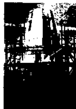
1981 Scaffolding supports the shell of the new tower