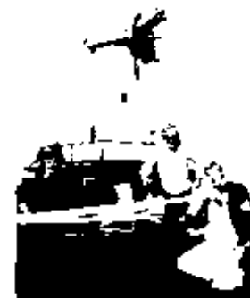
1986 Preparation of the sails and stocks for fitting