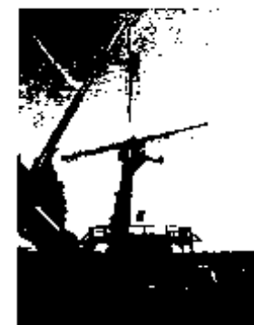
2005 After repairs on the cap on the ground, all was replaced again